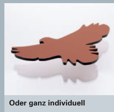
Oder ganz individuell